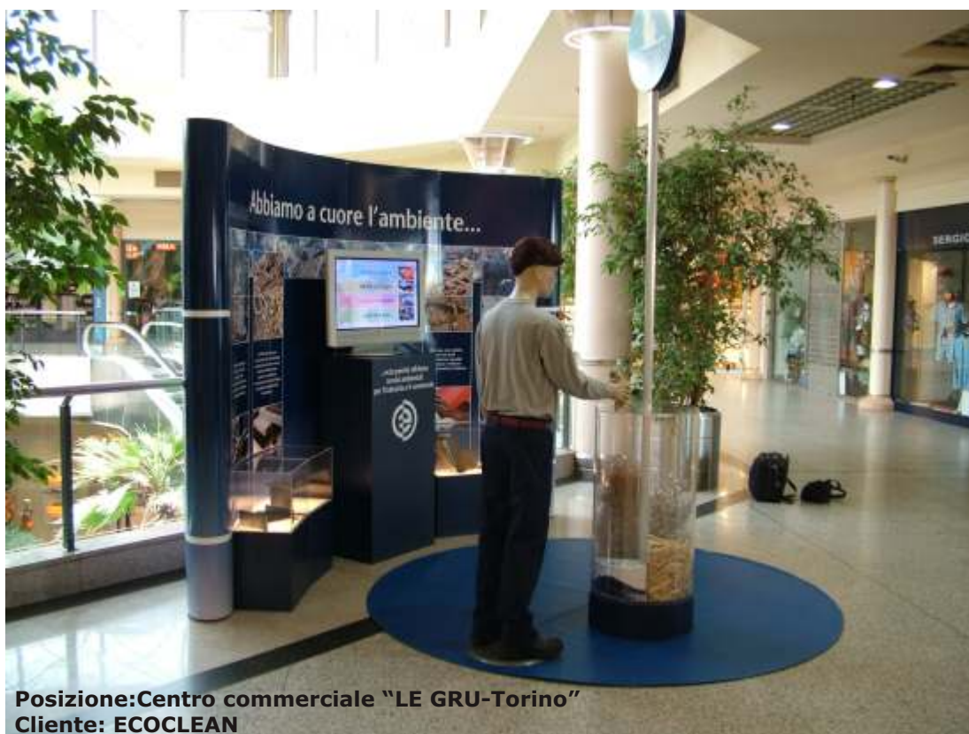
Posizione: Centro commerciale "LE GRU-Torino" Cliente: ECOCLEAN